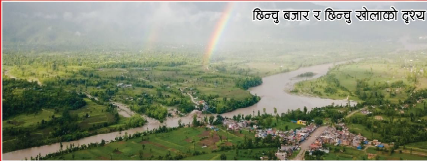
छिन्चु बजार र छिन्चु खोलाको दृश्य