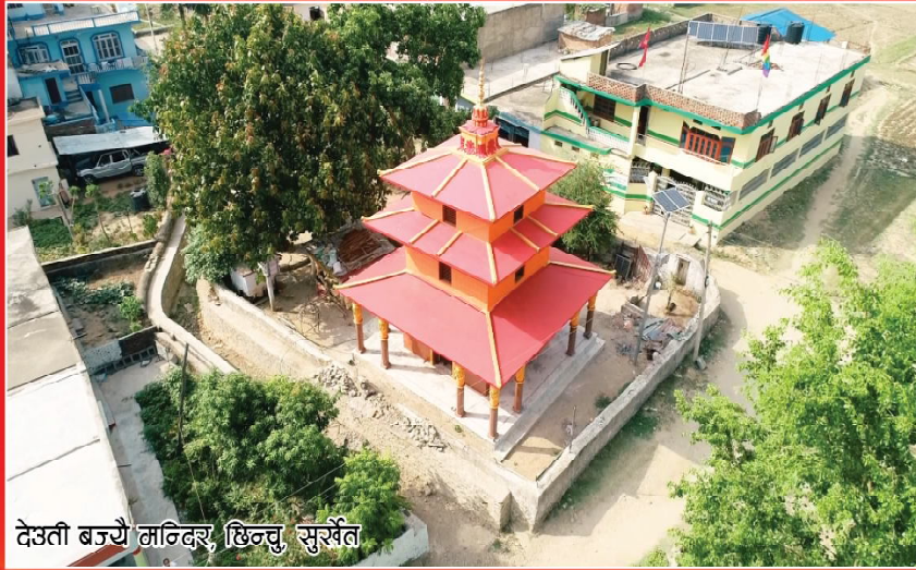
देउती बज्यै मन्दिर, छिन्चु, सुर्खेत