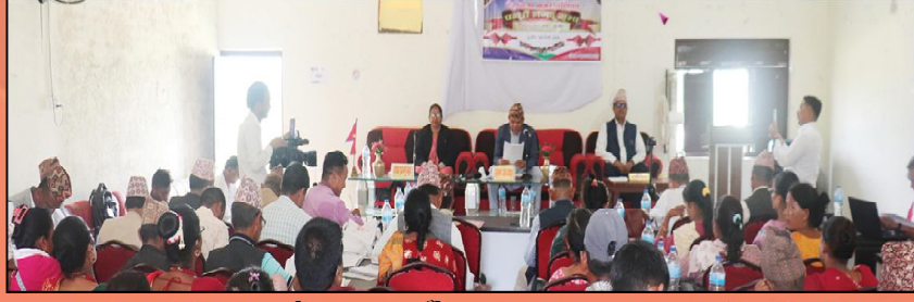
नगर सभामा नीति तथा कार्यक्रम वाचन गर्दै प्रमुख तथा उप-प्रमुख, प्रमुख प्रशासकीय अधिकृत