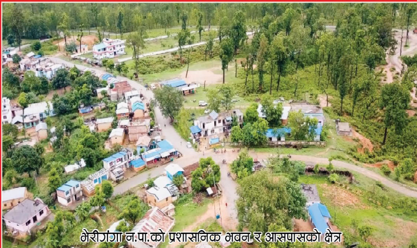
मेरीगंगा न.पा.को प्रशासनिक भवन र आसपासको क्षेत्र