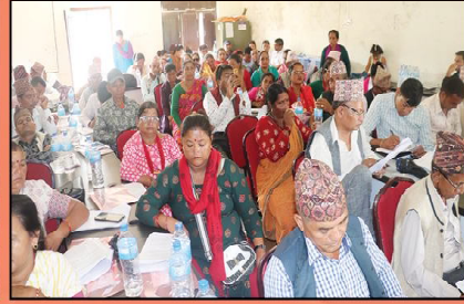
१५औं नगर सभामा उपस्थित सभा सदस्य ज्यूहरु नीति तथा कार्यक्रमका सहभागीहरु